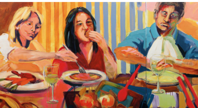
Iris Wöhr-Reinheimer | remember.me (Abendmahl) | 2013 | Acryl auf Leinwand/MDF | 100 x 2070 cm | 19tlg. (Detailansicht)

Eine etwas andere, da transformierte und sinngemäße bildliche Darstellung des Themas „Abendmahl“ hat die Böblinger Künstlerin Iris Wöhr-Reinheimer (*1958) für den Speisesaal des Tagungszentrums Hohenheim geschaffen. Ihre Aufgabe bestand darin, einen Gemälde-Fries mit intensivem Kolorit in das etwas nüchterne, farblich zurückgenommene postmoderne Ambiente des Speisesaals zu installieren. Die extremen Maße von 1 m x 20 m waren die besondere Herausforderung, vor die die Künstlerin gestellt wurde. Entstanden ist eine abwechslungsreiche Abfolge von diversen Tischszenen, die dem Alltag entlehnt wurden.